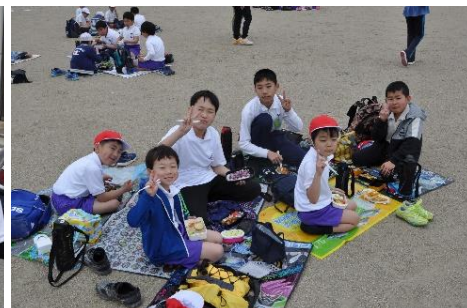
6年生がしっかりお世話をしていました。