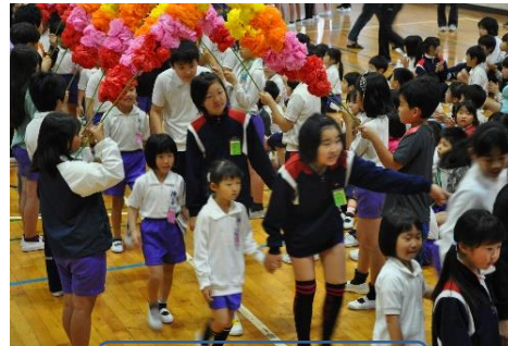
手をつないで入場

集会後、新田原グランドに向かいました。14時頃から雨という予報が出ていたので、予定を少し早めて出発し、最短コースで歩きました。6年生が1年生の手を引き、優しく声をかけながら一緒に歩いてくれました。お弁当が終わって少しパラパラと雨が落ちてきたので、学校に帰ってからおやつタイムと遊ぶ時間をとりました。1年生と6年生は体育館でゲームをしました。とても盛り上がっていました。他学年の子ども達は運動場で仲良く遊びました。