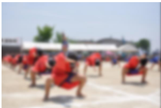
《3・4年生ソーラン節》